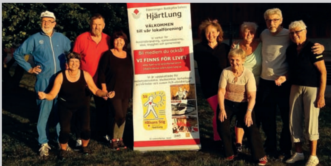
Utegymnastik i Tumba.